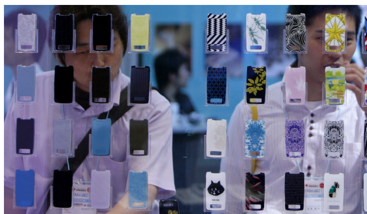
Panel expositivo con carcasas del modelo Sony Ericsson 'W53S'.

Así, Apple, Google y los coreanos Samsung y LG cotizan al alza, mientras que Nokia se revuelve para defender una hegemonía venida a menos. El resto de la vieja guardia del sector busca su sitio con desigual fortuna, como es el caso de Motorola, Sony Ericsson o Alcatel.